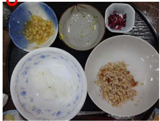
お粥や刻み食にも対応