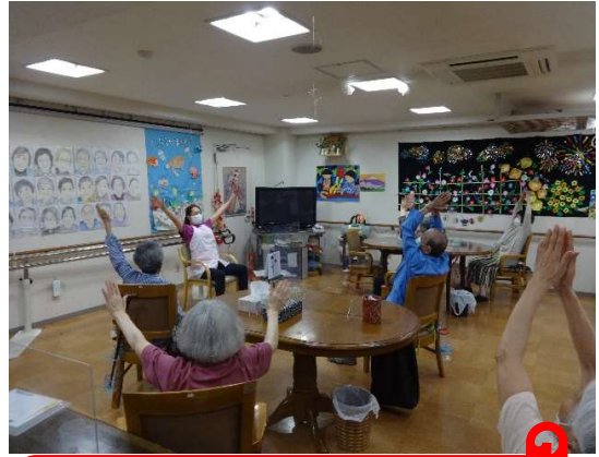
昼食後は全員で体操