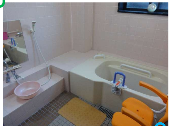
個浴対応のお風呂