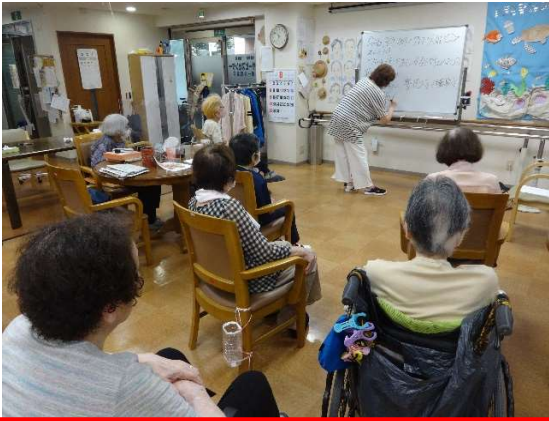
朝礼「脳トレや今日は何の日？」