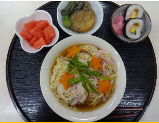
毎日楽しみな手作り昼食