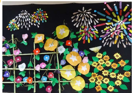
皆様で協力した共同作品